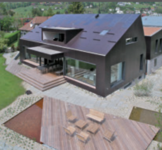
1. Mit Photovoltaik lassen sich auch sehr moderne Bauten realisieren.

Bauen Sie mit den Meistern – denn DIE MEISTER bauen besser.