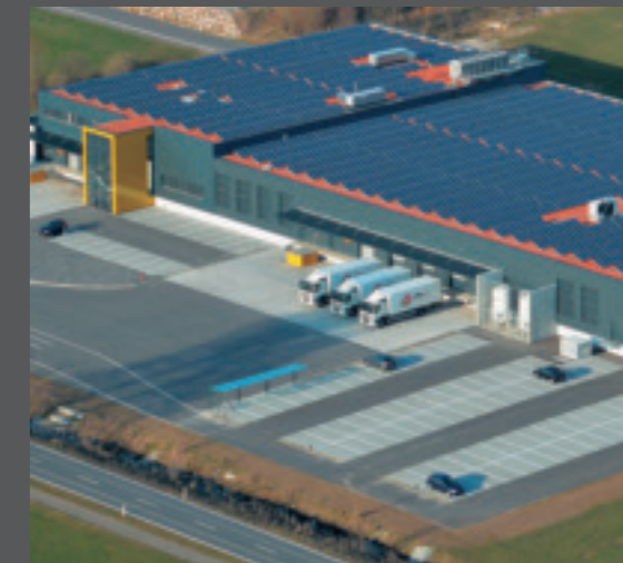
5. Grosse Dachflächen lassen sich mit Photovoltaik-Anlagen zusätzlich wirtschaftlich nutzen.