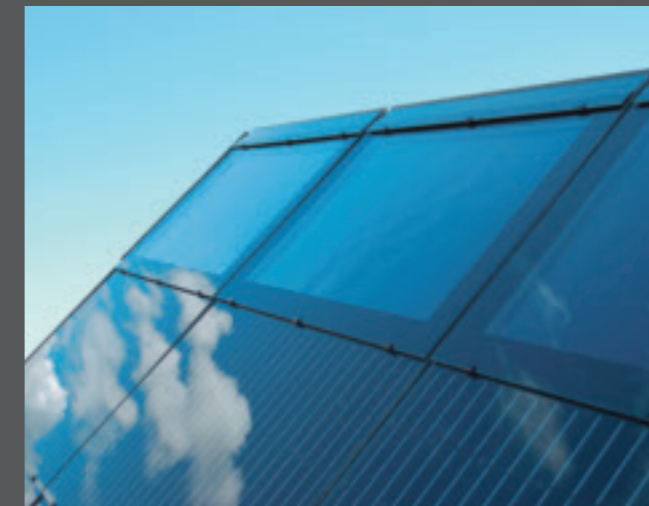
4. Solarthermie und Photovoltaik lassen sich optimal kombinieren.