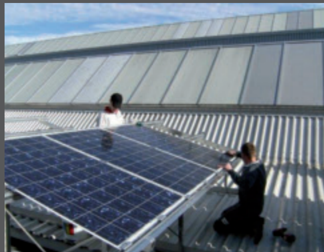
2. Aufdachsysteme sind die wirtschaftlichste Lösung für die optimale Energiegewinnung.