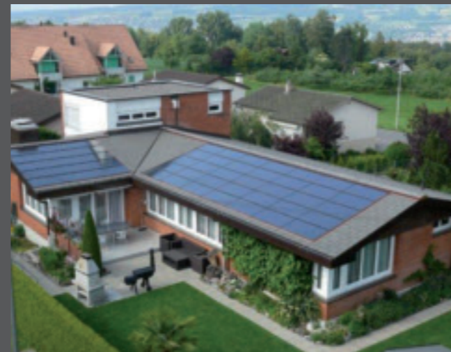
3. Auch bei bestehenden Bauten lässt sich Photovoltaik formschön integrieren.