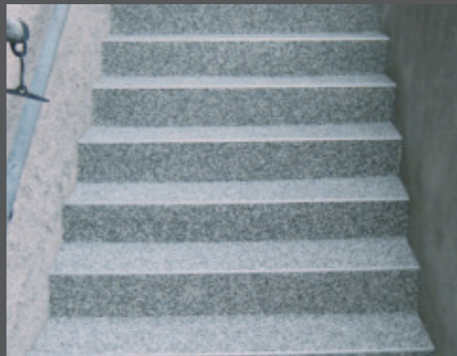
2. Natursteintreppe mit Flüssigkunststoffabdichtung.