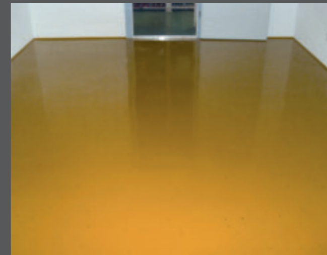
4. Hobbyraum mit Flüssigkunststoff, teilflächig mit Farbchips versehen.