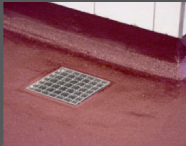
3. Abgesandeter, rutschfester Industrieboden in einer Metzgerei.