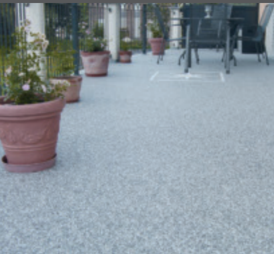
1. Sitzplatzabdichtung mit Natursteinbodenbelag.

Bauen Sie mit den Meistern – denn DIE MEISTER bauen besser.