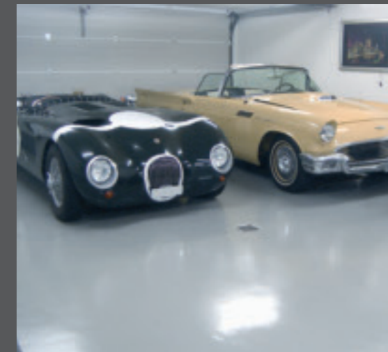
5. Garagenboden mit Anstrichsystem (Versiegelung) für eine optimale Sauberhaltung der Bodenfläche.